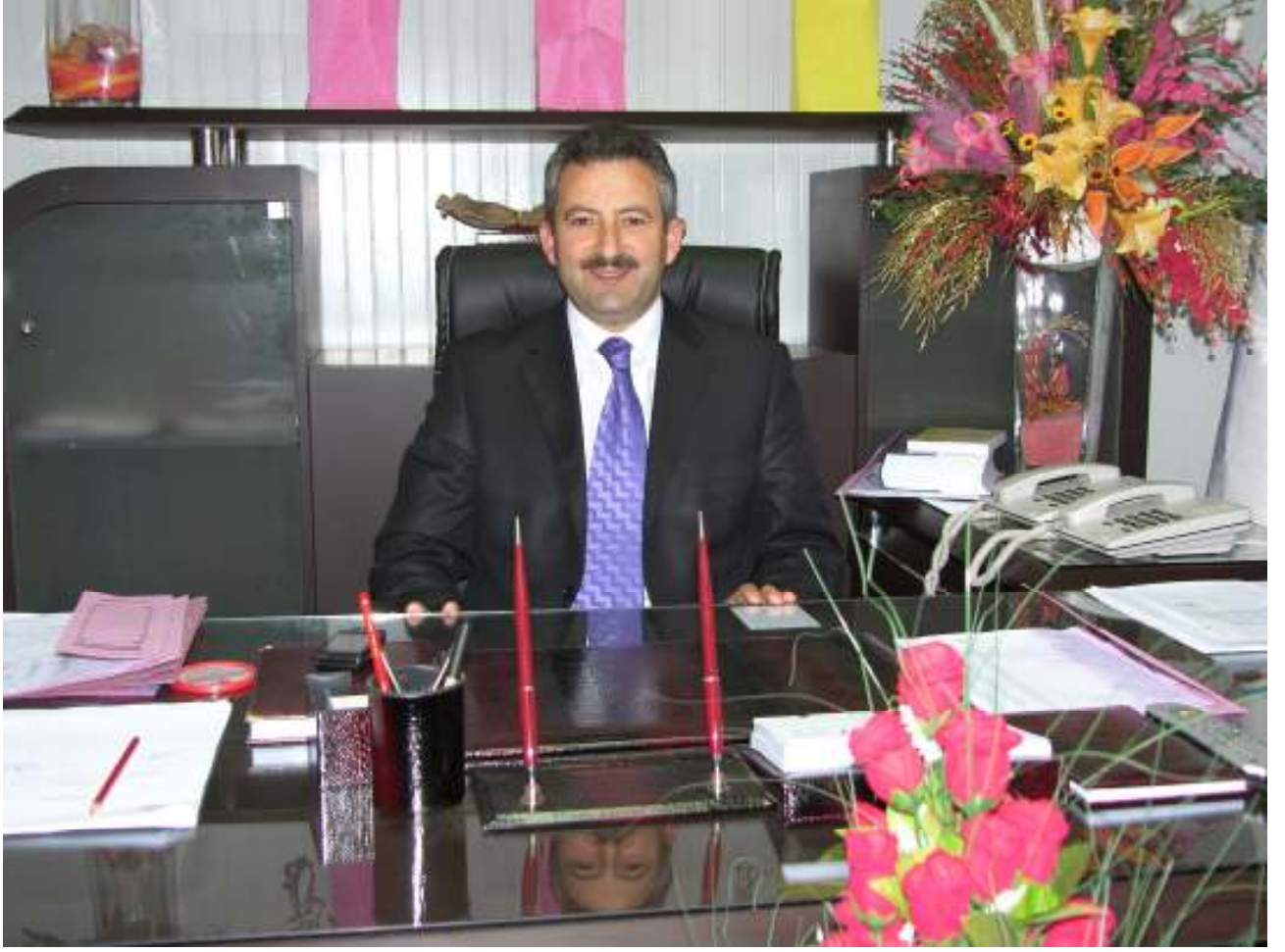
İZZET GÜNDOĞAR AYBASTI BELEDİYE BAŞKANI